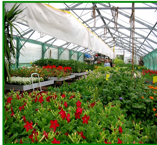
Gewächshaus / Standort : Hahnmühle

Im Bereich Dienstleistung & Soziales lernen Sie